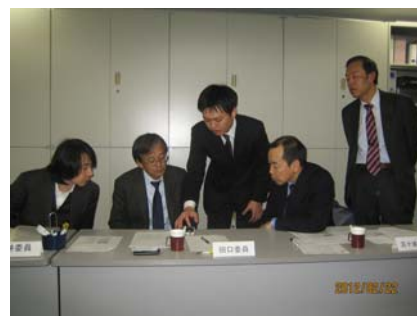
実証モデルシステム（スマートフォン画面）を見る委員